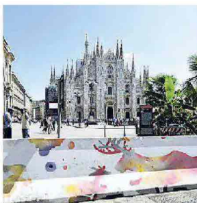
Milano, barriere al Duomo

riere, sulla Darsena e i Navigli e a corso Como, vicino alla torre Unicredit. L'amministrazione comunale ha poi lanciato un appello ai writer milanesi per colorare le barriere di cemento per renderli meno antiestetici, anche se l'idea resta quella di sostituire i new jersey con dei dissuasori di altro tipo: ad esempio i piloni uniti da catene d'acciaio collocati sul lungomare di Nizza dopo l'attentato del luglio 2016, che sono in grado di frenare la corsa dei tir. E c'è anche chi, come l'architetto Stefano Boeri, propone